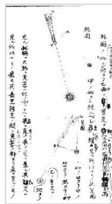
彗星概説 (重要文化財)