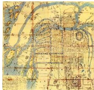
大阪古地図集成 第4図「新撰増補大坂大絵図」