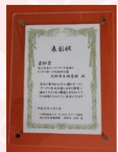
VLED 2018年度勝手表彰貢献賞