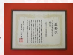
総務省 ICT地域活性化大賞2019優秀賞