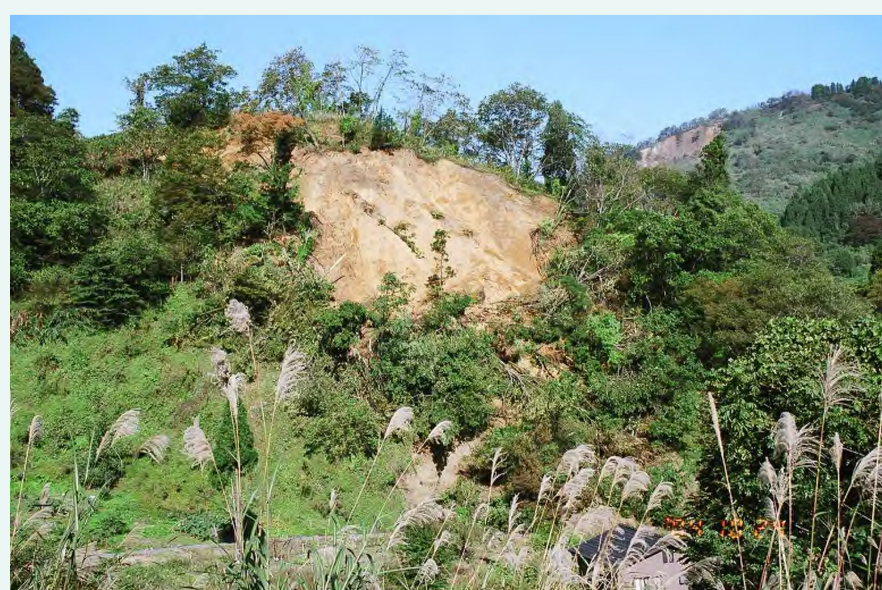
崩れた山肌(その1) 撮影日：2004/10/24