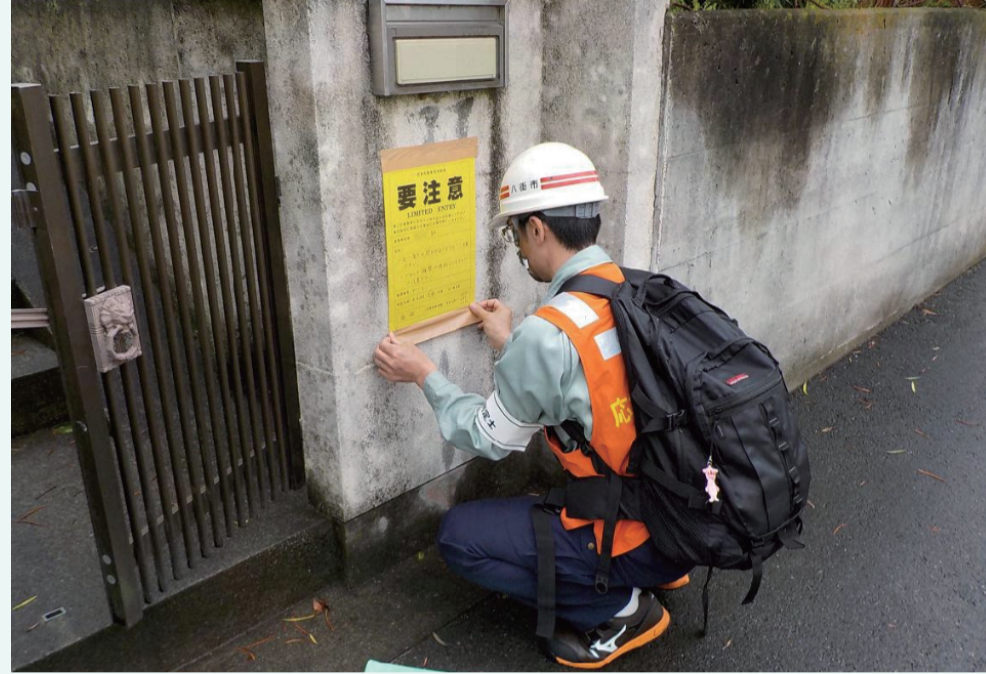
被災建築物応急危険度判定士活動 調査の様子 撮影日：2016/4/28