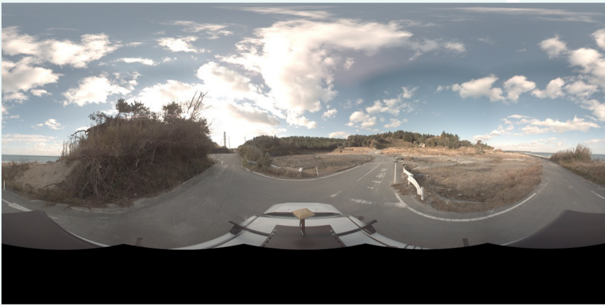
360度カメラ（全天周カメラ）による定点観測 撮影日：2011/12/13 撮影場所：福島県南相馬市鹿島区鳥崎

産官学の機関と連携して、東日本大震災に関するあらゆる記憶、記録、事例、知見を収集し、国内外や未来に共有するプロジェクトです。