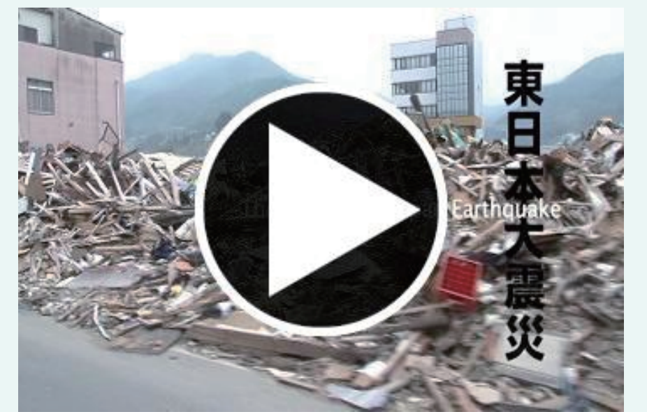
The Great East Japan Earthquake and Japanese NGOs : From emergency relief to reconstruction? A turning point for the future (2012年公開)