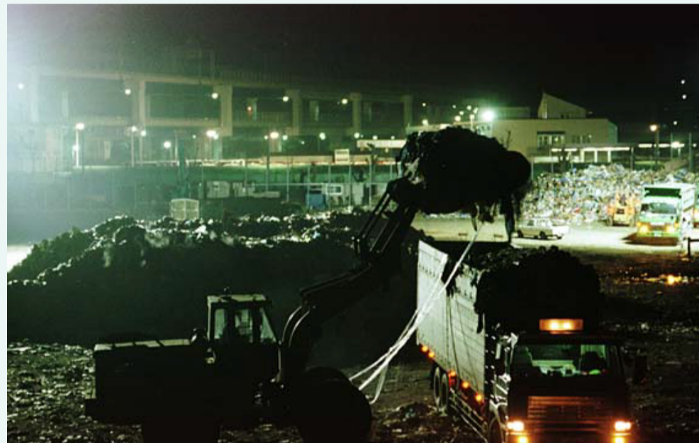
一時的にゴミ収集場となっている中央区の小野浜公園 では連日のようにゴミが運び込まれ、この日も深夜まで 作業が行われていた。

阪神・淡路大震災に関する資料を収集・保存するとともに、災害復興や地震研究・防災対策のために提供しています。