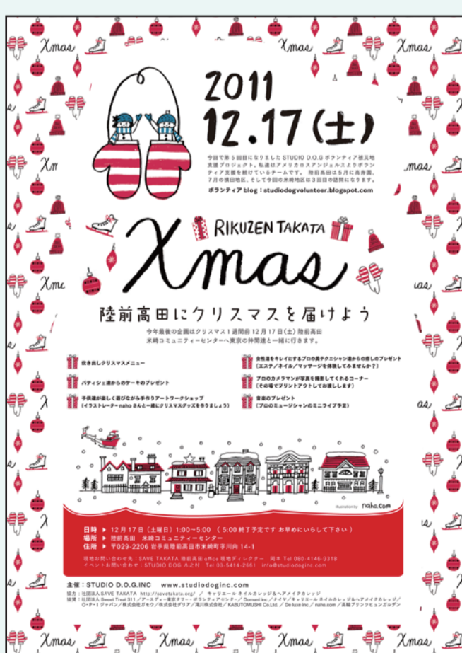
STUDIO D.O.G.inc 陸前高田にクリスマスを届けよう

主に岩手県内で東日本大震災からの復興支援活動を行った団体のチラシや資料を収録しています。