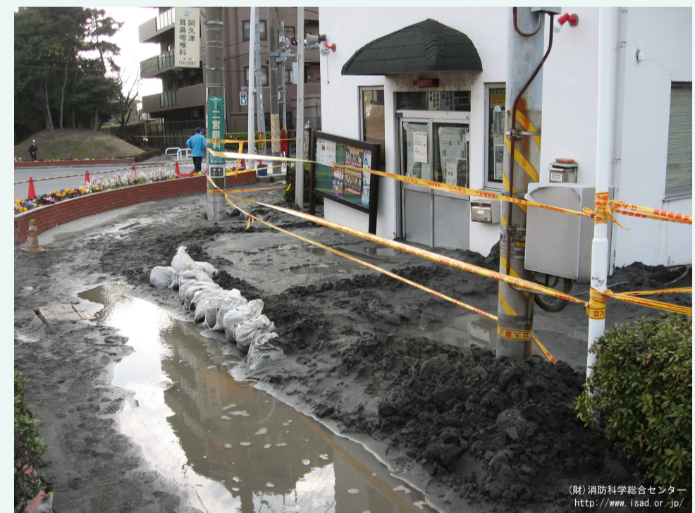
浦安市富岡交番液状化被害 撮影日：2011/3/20

消防防災科学センター 災害調査の活動、資料収集等を実施してきた過程において蓄積された写真を収録しています。