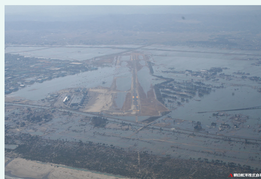
仙台空港(地点情報：2360) 撮影日：2011/3/12