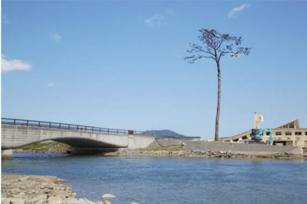
2013_07_22 一本松復活後写真_一本松 撮影日：2013/6/23