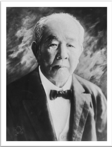
『 講演：道徳、 経済合一論 』 講演： 渋沢栄一